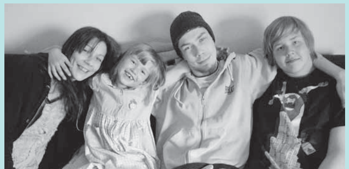
Sydämestä Asti ( Von Herzen )