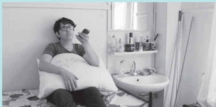
Onder de sterren was ik thuis (Unter den Sternen war ich zu Hause)