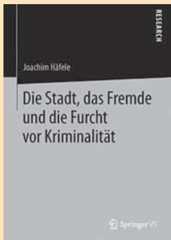
Joachim Häfele: Die Stadt, das Fremde und die Furcht vor Kriminalität. Wiesbaden 2013: Springer VS. 299 Seiten, 39,99 Euro