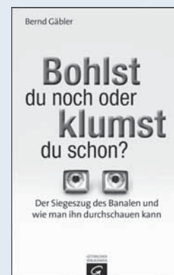
Bernd Gäbler: Bohlist du noch oder klumst du schon? Der Siegeszug des Banalen und wie man ihn durchschauen kann. Gütersloh 2013: Gütersloher Verlagshaus. 192 Seiten, 17,99 Euro