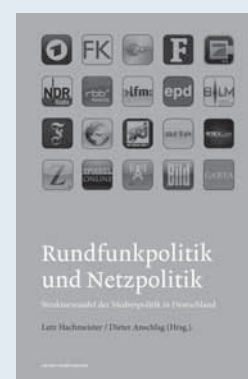
Lutz Hachmeister/Dieter Anschlag (Hrsg.): Rundfunkpolitik und Netzpolitik. Strukturwandel der Medienpolitik in Deutschland. Köln 2013: Herbert von Halem Verlag. 336 Seiten, 24,00 Euro