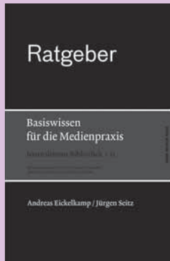
Andreas Eickelkamp/ Jürgen Seitz: Ratgeber. Basiswissen für die Medienpraxis. Köln 2013: Herbert von Halem Verlag. 256 Seiten, 19,50 Euro