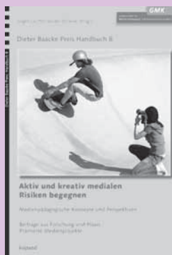
Jürgen Lauffer/ Renate Röllecke (Hrsg.): Aktiv und kreativ medialen Risiken begegnen. Medienpädagogische Konzepte und Perspektiven. München 2013: kopaed. 168 Seiten, 16,00 Euro