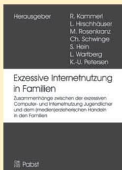
Rudolf Kammerl/Lena Hirschhäuser/Moritz Rosenkranz u. a. (Hrsg.): EXIF – Exzessive Internetnutzung in Familien. Zusammenhänge zwischen der exzessiven Computer- und Internetnutzung Jugendlicher und dem (medien)erzieherischen Handeln in den Familien. Lengerich 2012: Pabst. 196 Seiten, 20,00 Euro