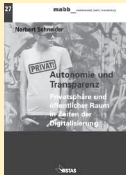
Norbert Schneider: Autonomie und Transparenz. Privatsphäre und öffentlicher Raum in Zeiten der Digitalisierung. Berlin 2013: Vistas. 147 Seiten, 12,00 Euro