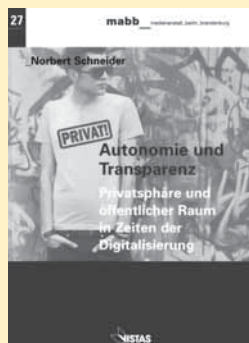
Norbert Schneider: Autonomie und Transparenz. Privatsphäre und öffentlicher Raum in Zeiten der Digitalisierung. Berlin 2013: Vistas. 147 Seiten, 12,00 Euro