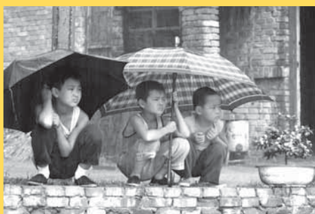
Don't Expect Praises, Jin, Princesas Rojas (v. l. n. r.)