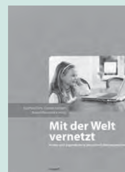
Burkhard Fuhs/Claudia Lampert/Roland Rosenstock (Hrsg.):

inter-cool 3.0. Jugend, Bild, Medien. Ein Kompendium zur aktuellen Jugendkulturforschung. München 2010: Wilhelm Fink Verlag. 480 Seiten m. Abb., 34,90 Euro