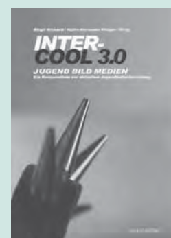
Birgit Richard/Heinz-Hermann Krüger (Hrsg.):

Allgemeinbildung in Deutschland. Erkenntnisse aus dem SPIEGEL-Studententest-PISA. Wiesbaden 2010: VS Verlag für Sozialwissenschaften. 367 Seiten m. Abb. u. Tab., 39,95 Euro